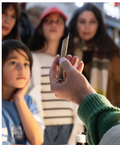
Besançons 2025

Chaque année, les Journées Européennes des Métiers d'Art® (JEMA) marquent le printemps, avec une semaine de festivités dédiée aux métiers d'art. Partout en France et en Europe, le public est invité à rencontrer les artisans d'art et à découvrir leurs savoir-faire d'exception, à travers des milliers d'événements. Les JEMA® ont déjà permis plus de 20 millions de visites depuis leur création. Le Centre-Val de Loire, région française, et la Belgique, pays européen, seront mis à l'honneur à l'occasion de cette 20 e édition qui se tiendra du 7 au 12 avril 2026, autour du thème « Cœurs à l'ouvrage ».