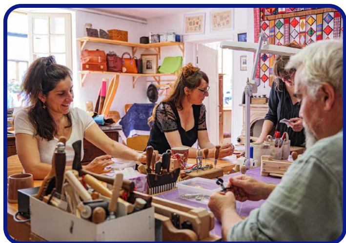
Atelier Nina Paris

« La thématique "Cœurs à l'ouvrage" met en lumière l'importance des énergies partagées des synergies culturelles et territoriales et du dynamisme rural. [...] En 2026, prenons la route, empruntons les sentiers, explorons les paysages des métiers d'art. Ensemble, à travers territoires et gestes, mettons nos coeurs à l'ouvrage