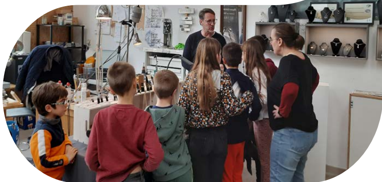
Village des Métiers d'Art

Les artisans d'art, établissements de formations, lieux culturels et porteurs de projets qui souhaitent participer aux JEMA® 2026 peuvent dès à présent inscrire leurs événements sur le site www.journeesdesmetiersdart.fr/candidatures jusqu'au 31 janvier 2026 inclus.