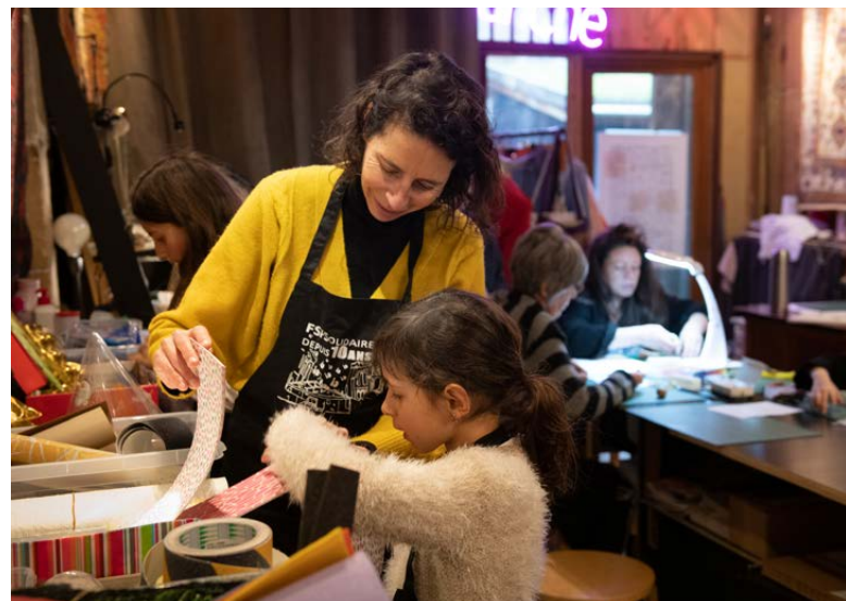
Artefact - JEMA2023