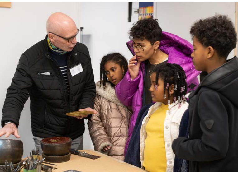
Academie de Bijouterie JEMA2023

Dans toute la France, au travers d'ateliers dédiés, de démonstrations ludiques, d'activités et de visites interactives, le jeune public pourra découvrir et expérimenter la matière, le geste, le beau. Une rencontre et des activités jeune public seront pas exemple à découvrir à Sauxillanges (Auvergne-Rhône-Alpes), une initiation à la céramique et à la poterie à l'atelier Plou'Arts'Terre (Bretagne), une exposition de créations d'apprentis et d'étudiants au musée des Arts décoratifs de Strasbourg, une visite pédagogique à la découverte de la tapisserie à Aire-sur-la-Lys (Hauts-de-France), un atelier-découverte de la marqueterie au Labo Voluptas à Paris (Île-de-France), ou encore des démonstrations ludiques à l'atelier de soufflage de verre au chalumeau d'Audrey SeR à Daux (Occitanie). Ces journées seront aussi l'occasion d'éveiller des vocations, de découvrir des formations et de s'intéresser à la richesse des parcours des professionnels des métiers d'art.