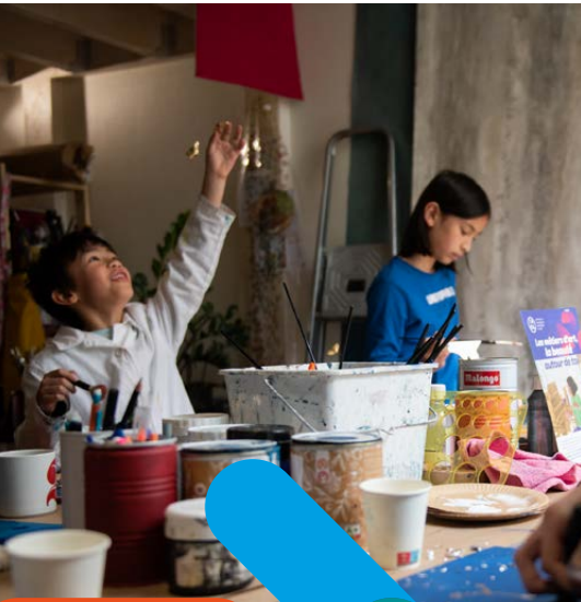
Atelier Mayeul Gauvin - JEMA2023